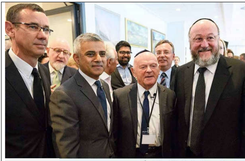
صادق خان در کنار سفیر اسرائیل، مارک رگف

2005 - 2007 عضو کمیته حساب‌های عمومی 2005 تاکنون؛ عضو پارلمان برای توتینگ لندن سوابق مشاغل غیرسیاسی 1997 - 2005 خدمت در انجمن کریستین خان 1994 - 1997 خدمت به‌عنوان وکیل در کریستین خان صادق خان و اسلام